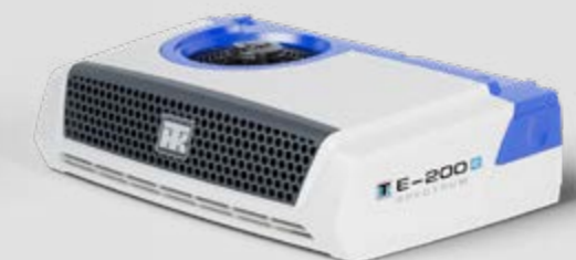
ANSICHT VON RECHTS