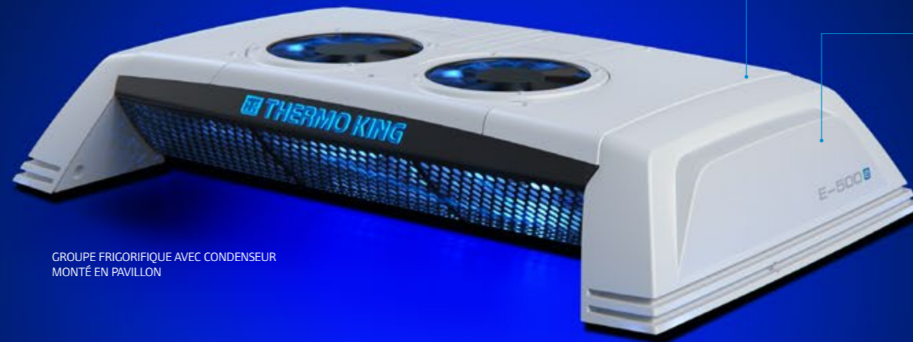
GROUPE FRIGORIFIQUE AVEC CONDENSEUR MONTÉ EN PAVILLON

UNE SOLUTION DE RÉFRIGÉRATION POLYVALENTE QUI CONSTITUE LA RÉPONSE DES BEV AUX LIMITATIONS IMPOSÉES DANS LES CENTRES URBAINS.