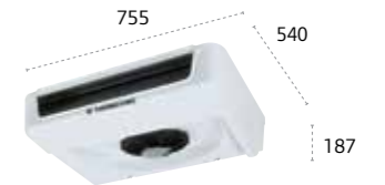
ES150 MAX Ultraflachverdampfer