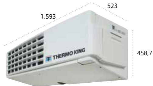
V-800/V-800 MAX/V-800 MAX Spectrum