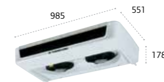
ES300/ES300 MAX Ultraflachverdampfer