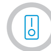
Ein-/Ausschalten einzelner Laderäume.