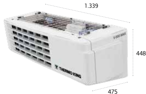
V-500/V-500 MAX/ V-600 MAX/V-500 MAX Spectrum