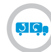
Einstellbarer Sollwertbereich für jeden Laderaum.