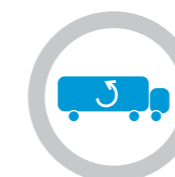
Einfachtemperaturbetrieb bei Bedarf.